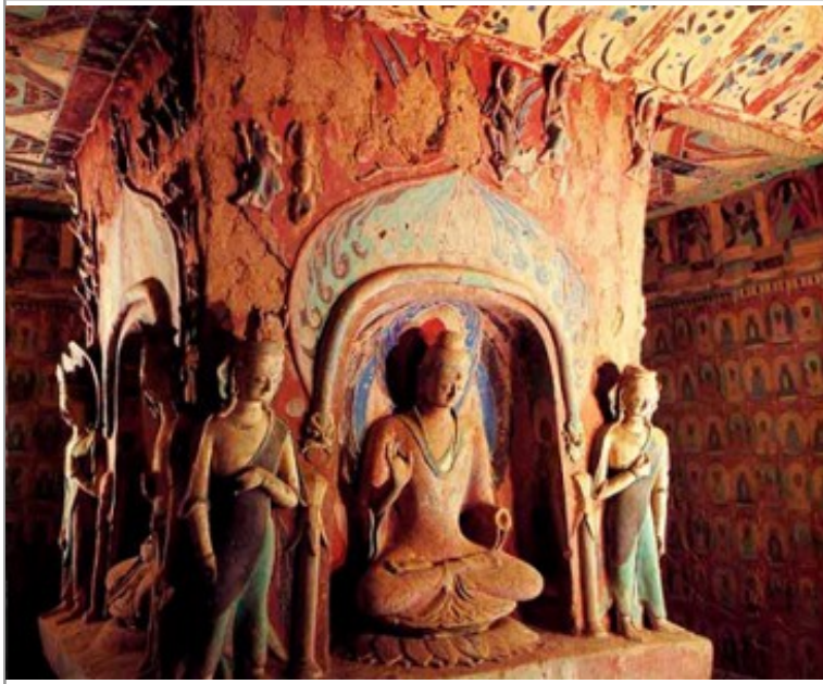
L'espace du sacré - Jeudis de l'art